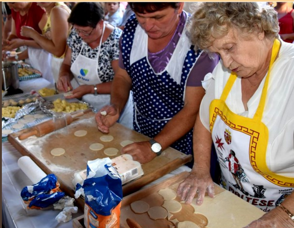
Dożynkowe lepienie pierogów

Poprzez warsztaty, inscenizacje i wykłady uczestnicy mogą poznać różne rodzaje mąk i potrawy, których głównym składnikiem jest biały puch oraz upiec własnoręcznie przygotowany chleb lub ugotować świeżo ulepione pierogi.