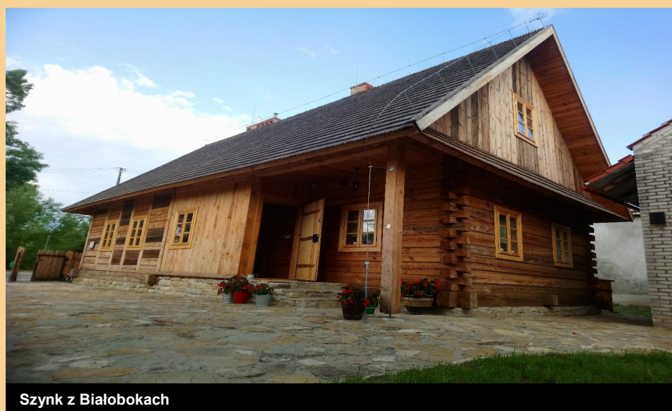
Szynk z Białobokach

“oferuje warsztaty oparte na wiedzy przekazywanej z pokolenia na pokolenie, gry terenowe uwarunkowane położeniem geograficznym nierozzerwalnie związanym z historią białobockiego zamku...”