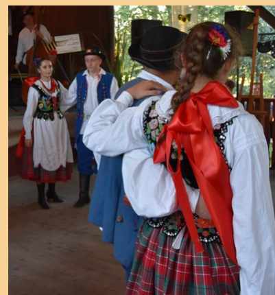
Para tańcząca Gacoka

Dzięki pokazom i prowadzonym warsztatom uczestnicy mają niepowtarzalną okazję dotknąć historii naszej okolicy.